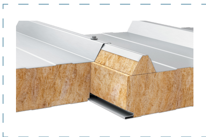
Schemat łączenia płyt