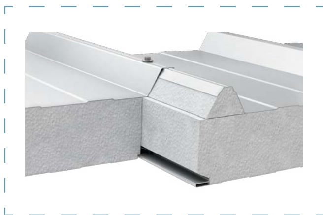
Schemat łączenia płyt